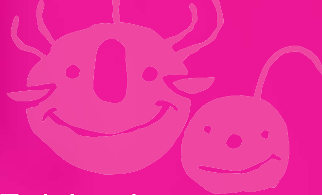
Table des matières