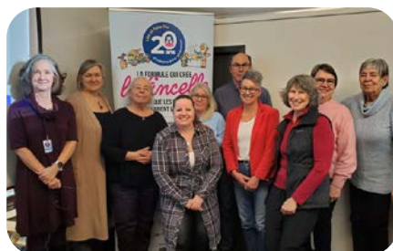
Bibliothèque Roland-LeBlanc, Saint-Basile-le-Grand