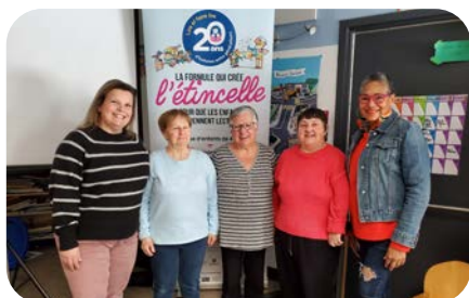
CPE Ses Amis, Boucherville

CPE Ses Amis, Boucherville Académie internationale Charles-Lemoyne, Longueuil