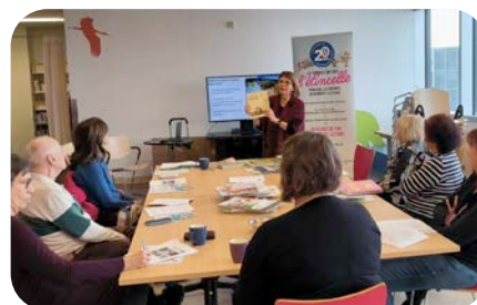
Bibliothèque interculturelle de Côte-des-Neiges, Montréal